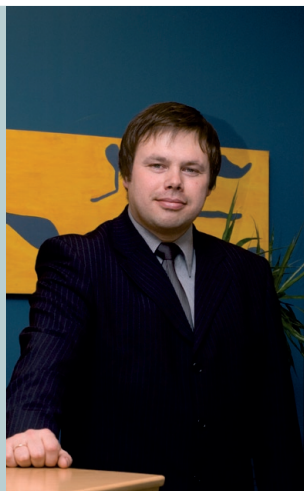
Imre Madison Juhatusesimees

Aastal 2005 on seltsi olulisemad projektid jätkuvalt seotud turupositsiooni tugevdamisega – eesmärk on jõuda müügimahtudeni, mis säilitavad seltsile kolmanda turupositsiooni ning tagavad turuosa kasvamise. Müügivaldkonnas on seltsi peamine koostööpartner jätkuvalt AS Sampo Pank. Koostöös Sampo finantskontserni teiste ettevõtetega jätkab selts aktiivsete tootekampaaniate ja uudsete tootelahenduste pakkumist klientidele. Seltsi konkurentsivõime parandamiseks turul planeeritakse mitmeid tootearenduslikke ja turunduslikke aktsioone. Samavõrd oluline on tagada seltsi efektiivne tegutsemine kõikides valdkondades. Investeeringute juhtimisel jätkatakse koostööd Sampo Baltic Asset Management ASiga. Aasta vahetus tõi kaasa muudatuse edasikindlustuse valdkonnas, kus senise partneri Swiss Reinsurance Company asemel tehakse uute lepingute edasikindlustamisel koostööd Hannover Rueckversicherung AGga.